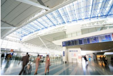
Bandara Internasional Fukuoka