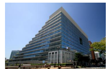
Kantor FiSSC di dalam gedung ACROS Fukuoka