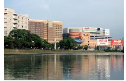
Pusat Perbelanjaan Canal City