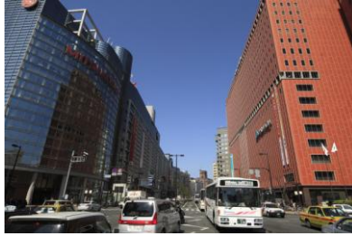
Pusat Kota Tenjin